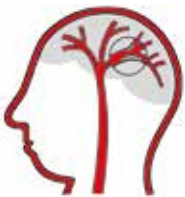
Afsluiting van een bloedvat